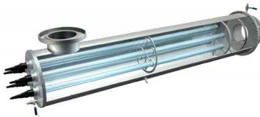
Dæmi um tæki til UV-lýsingar

Óvíst er hvað það mun taka okkur langan tíma að koma þessum búnaði upp. Velja þarf heppilegt tæki, gera innkaup, útvega húsnæði fyrir það o.s.frv. Allt kapp verður lagt á að þessi tími verði eins stuttur og kostur er.