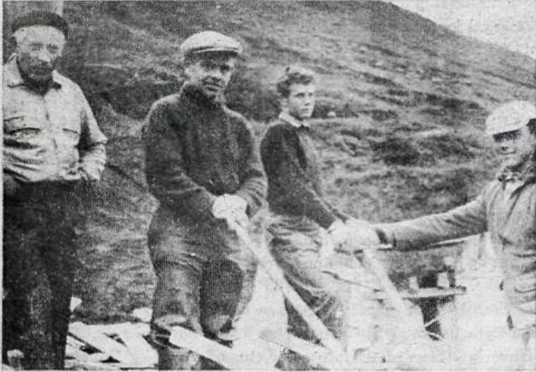
Þeir bíða eftir að sleðinn færi þeim næstu hræru. (Ljósmynd: E. D.).