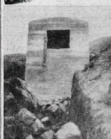
Brunnhús og safngeymi. — (Ljósmynd: E. D.).

Vatnsveitan keypti sér Fordson dráttarvél í sumar og tekur hún þar við, sem bílveg þrýtur og hefur komið sér vel. En síðasta